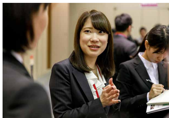
新卒採用自社イベント「キャリアマッチングLIVE」